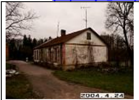
18. Tvertas iš PV pusės