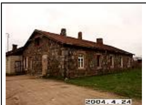
10. Gyvenamas namas iš PR pusės