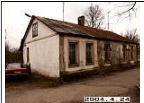
19. Tvertas iš ŠV pusės