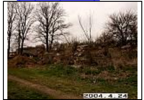
25. Kumetyno kiaulidės griuvėsiai