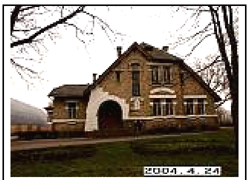
4. Rūmai iš Š pusės