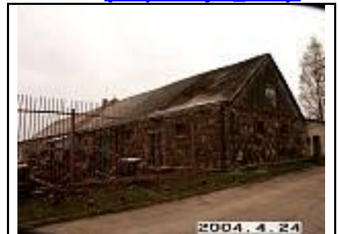
20. Tvertas iš PV pusės