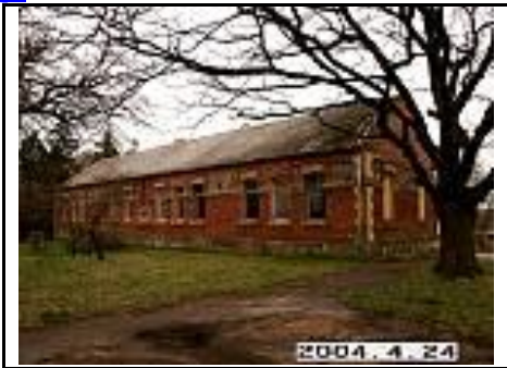
13. Kumetynas iš ŠV pusės