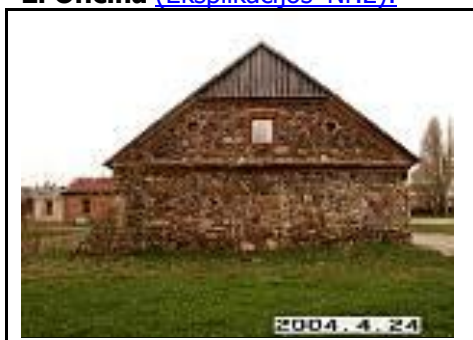
6. Oficina iš P pusės