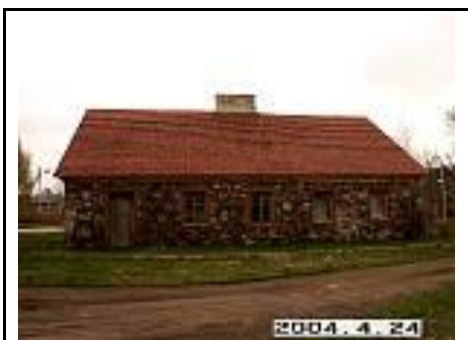
7. Oficina iš R pusės