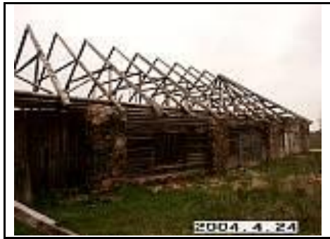
24. Klojimo fragmentas