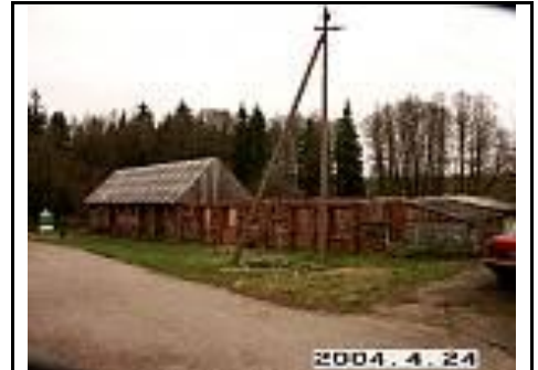
17. Ūkinis pastatas iš PV pusės