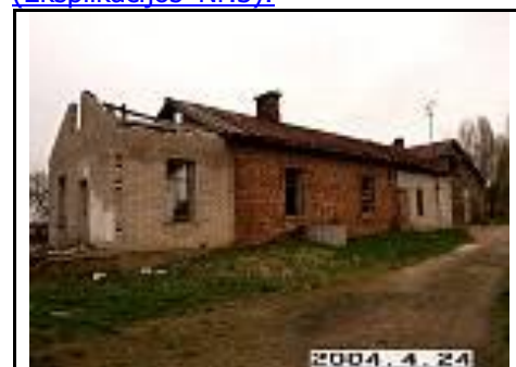
11. Gyvenamas namas iš ŠV pusės