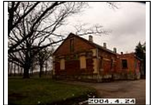
14. Kumetynas iš PR pusės