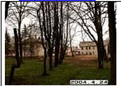
26. Bendras vaizdas iš V pusės link gyvenamųjų namų Nr.19 - 24