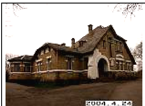
5. Rūmai iš SR pusės