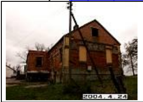
12. Kumetynas iš ŠR pusės