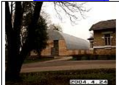
27. Sporto salė, esanti šalia dvaro rūmų