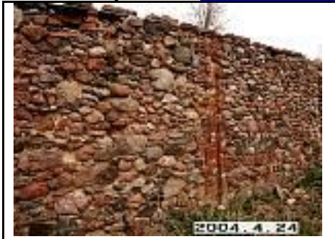
15. Ūkinio pastato sienos fragmentas