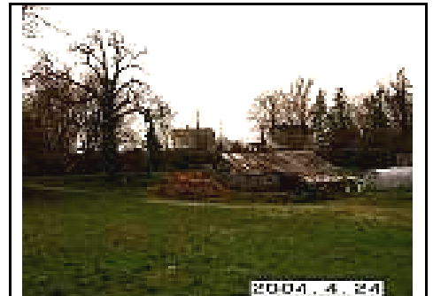
30. Bendras teritorijos vaizdas