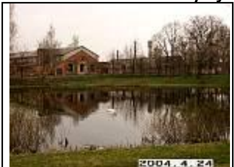
31 Prūdas priešais rūmus, iš PV pusės, tolumoje matosi pastatai Nr.7 ir Nr.8