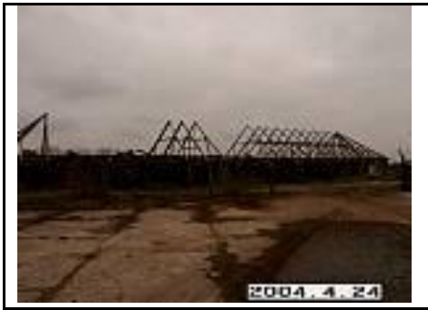
23. Klojimo griuvėsiai