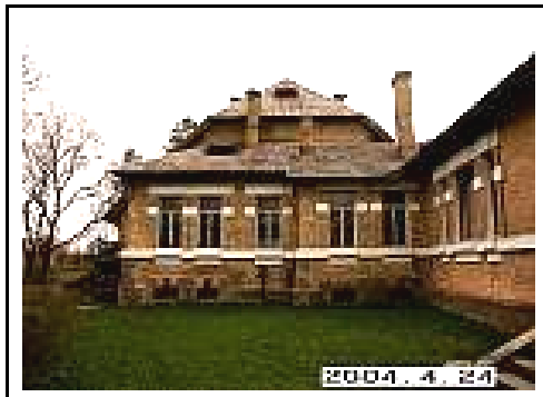
2. Rūmai iš P pusės