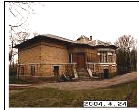
3. Rūmai iš PR pusės