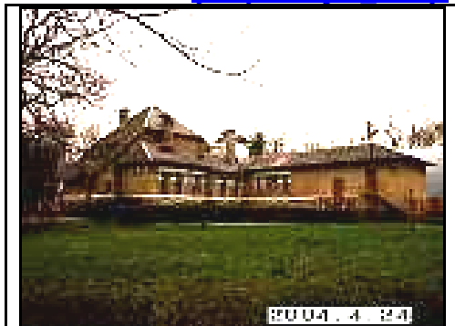
1. Rūmai iš PV pusės