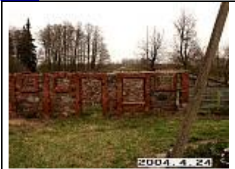
16. Ūkinio pastato fragmentas