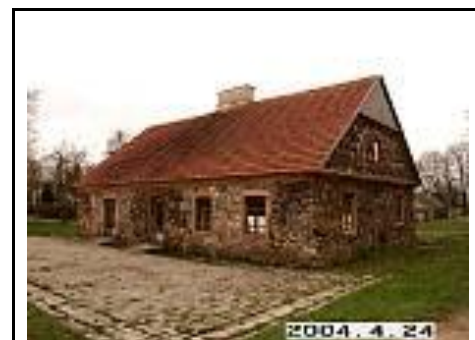
8. Oficina iš ŠV pusės