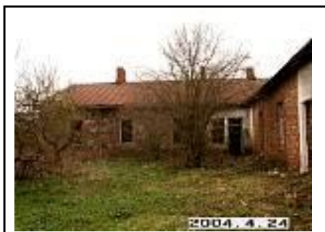
9. Gyvenamas namas iš V pusės