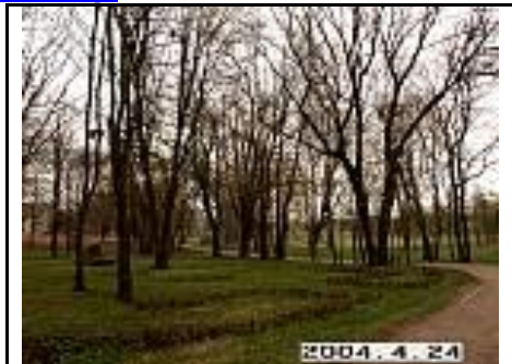
29. Parko fragmentas