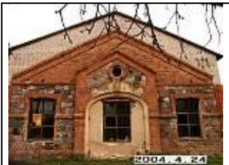
22. Arklidės P fasado fragmentas