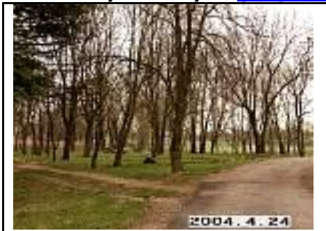
28. Parko fragmentas