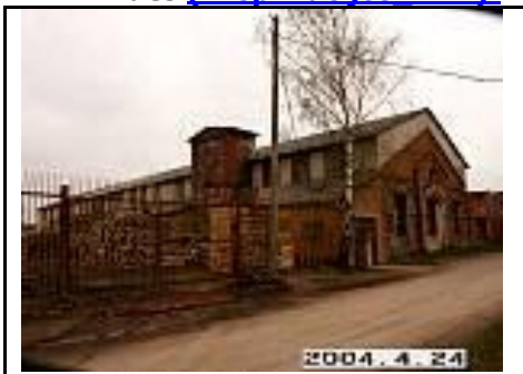
21. Arklidės iš PV pusės