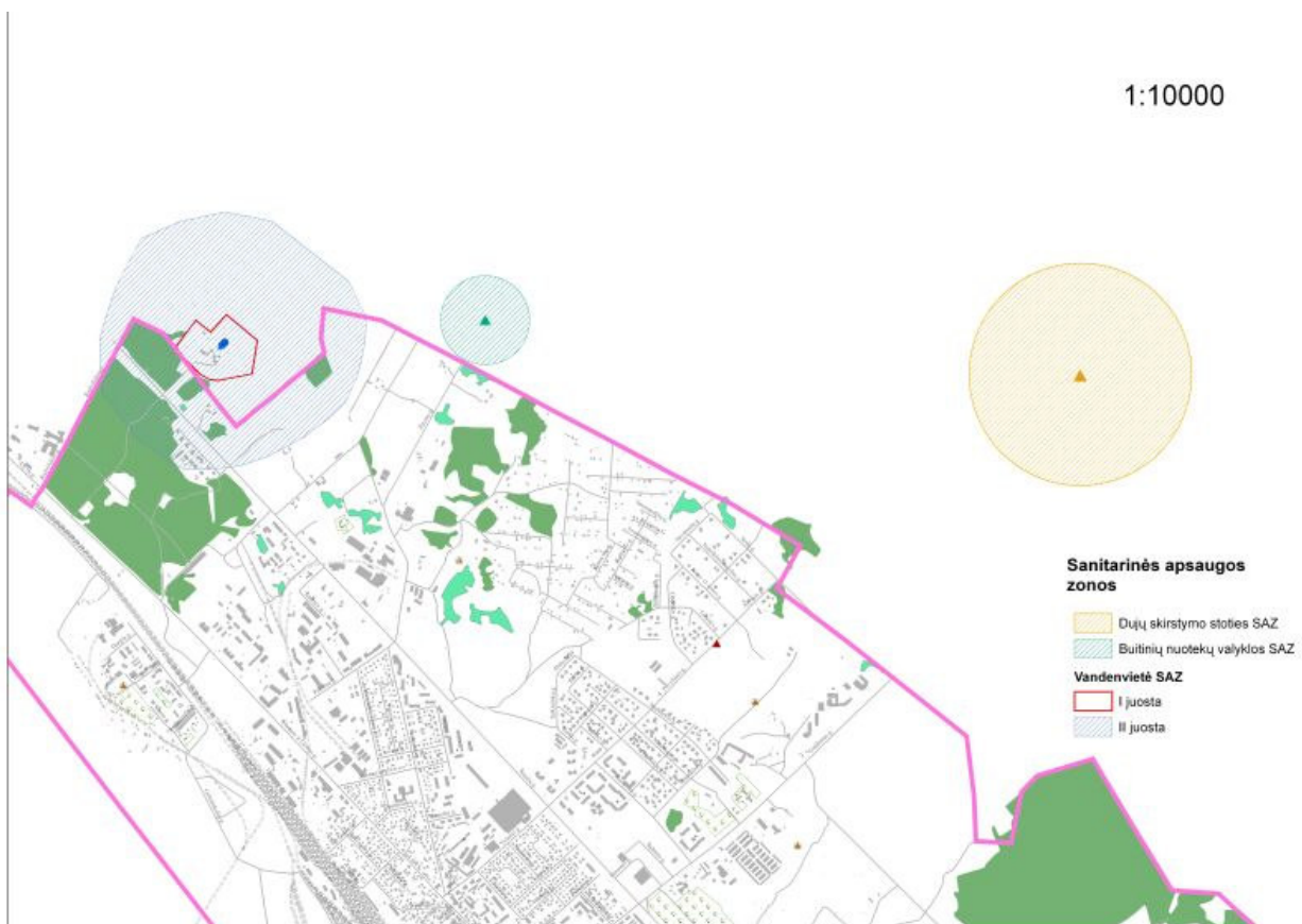
6.1 pav. Inžinerinių statinių apsauginės zonos

Miesto plėtrą ribojančios inžinerinių statinių apsauginės zonos yra pažymėtos 6.1 pav.