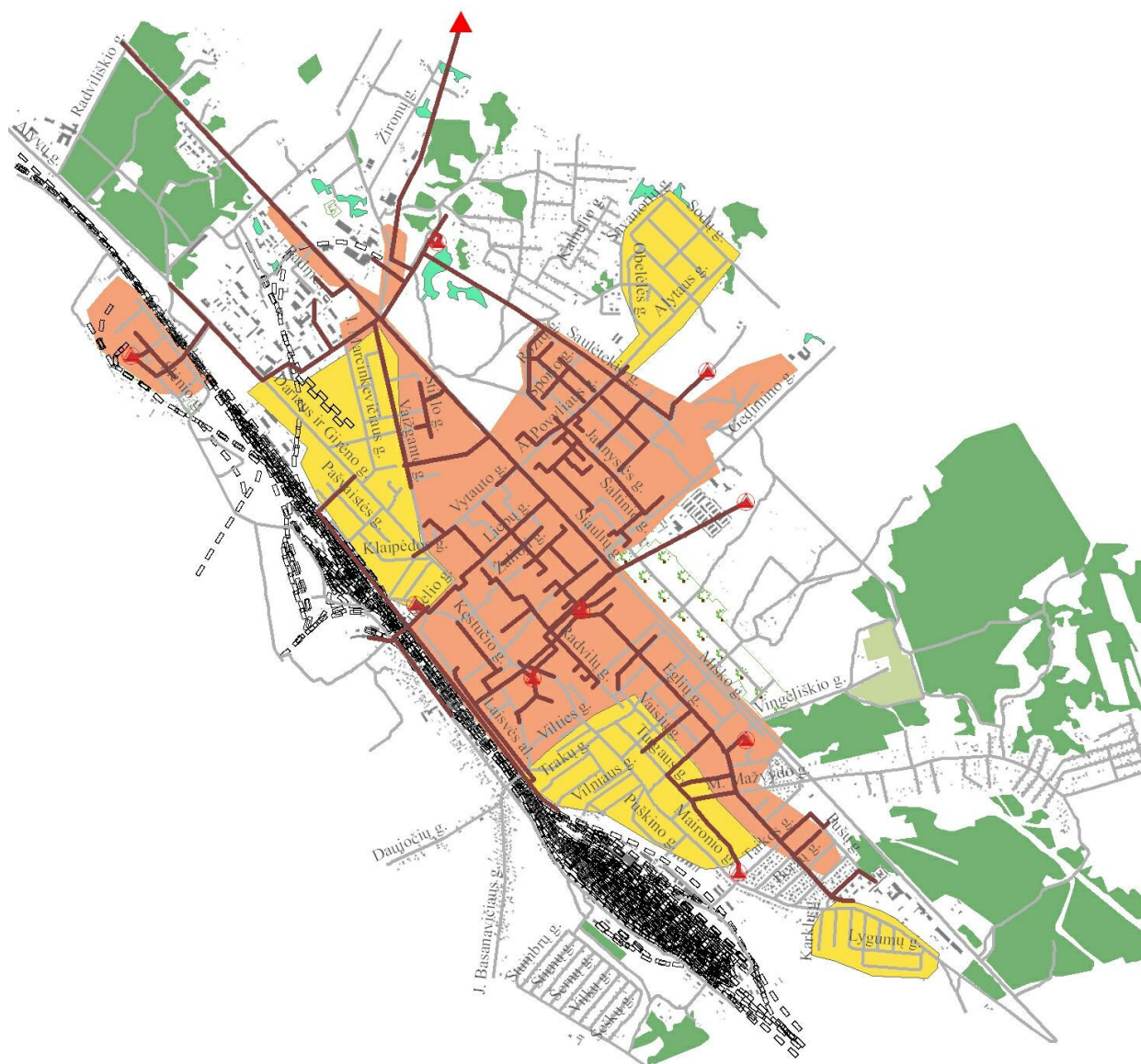
6.3 pav. Radviliškio miesto aprūpinimas buitinių nuotekų centralizuoto surinkimo infrastruktūra

Siekiant, kad šilumos vartotojai Radviliškio mieste būtų aprūpinami šiluma mažiausiomis sąnaudomis ir neviršijant didžiausio leidžiamo poveikio aplinkai, miesto centralizuoto šilumos ir gamtinių dujų tiekimo tinklai turi būti plėtojami atsižvelgiant į Radviliškio rajono šilumos ūkio specialiojo plano nuostatas. Šilumos ūkio specialusis planas turi būti periodiškai atnaujinamas įstatymų nustatyta tvarka.